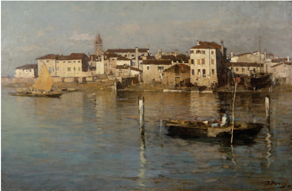
Venezia scomparsa, 1887 olio su tela, cm 80 x 120. Collezione privata