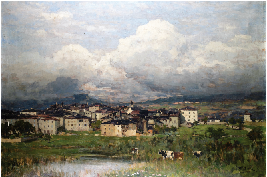
Da Cles, 1891 olio su tela, cm 71 x 101. Collezione privata