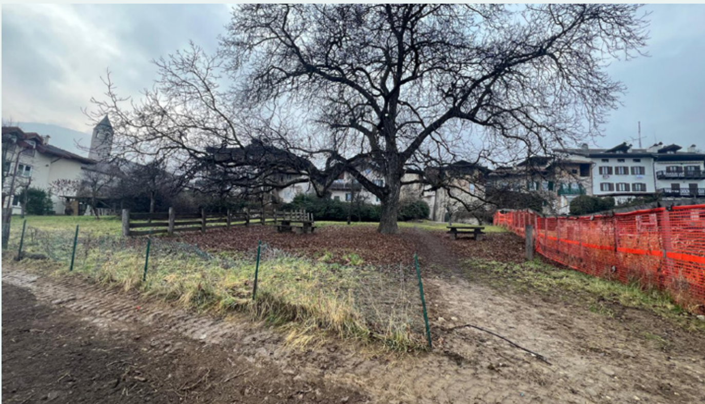
Il parco della Nogara