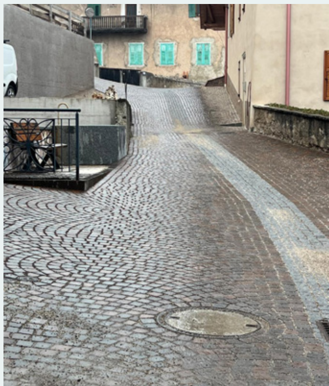
Nuova pavimentazione in porfido a Mechel