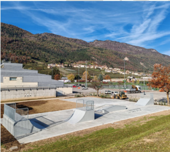
Il nuovo skatepark realizzato al Ctl

Il bilancio economico-finanziario del Comune di Cles è particolarmente solido e con interessanti prospettive di crescita che siamo nuovamente riusciti ad approvare senza ricorrere ad alcun tipo di aumento delle aliquote e delle quote a carico di cittadini e famiglie per coprire il costo dei servizi comunali. L'IMIS, i costi dell'acquedotto, quelli di fognature e spazzamento, i prezzi dei parcheggi, l'addizionale IRPEF e soprattutto il costo del servizio di Asilo Nido, infatti, sono rimasti invariati. Ci sono quindi ancora margini di crescita futura per il nostro bilancio che possono servire in futuro per sostenere nuovi servizi primari alla cittadinanza.