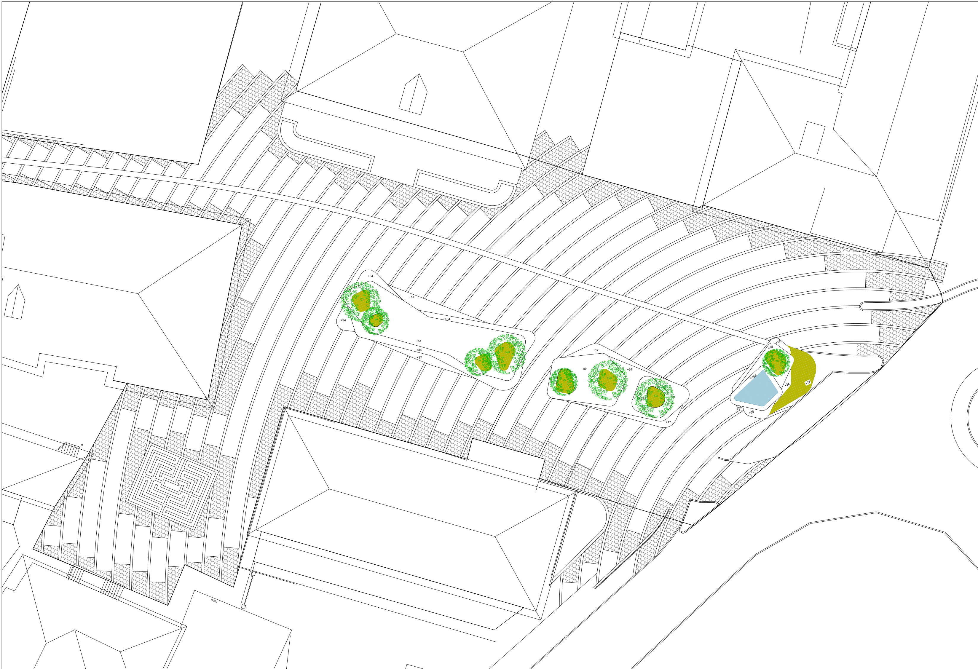
PLANIMETRIA CORSO DANTE