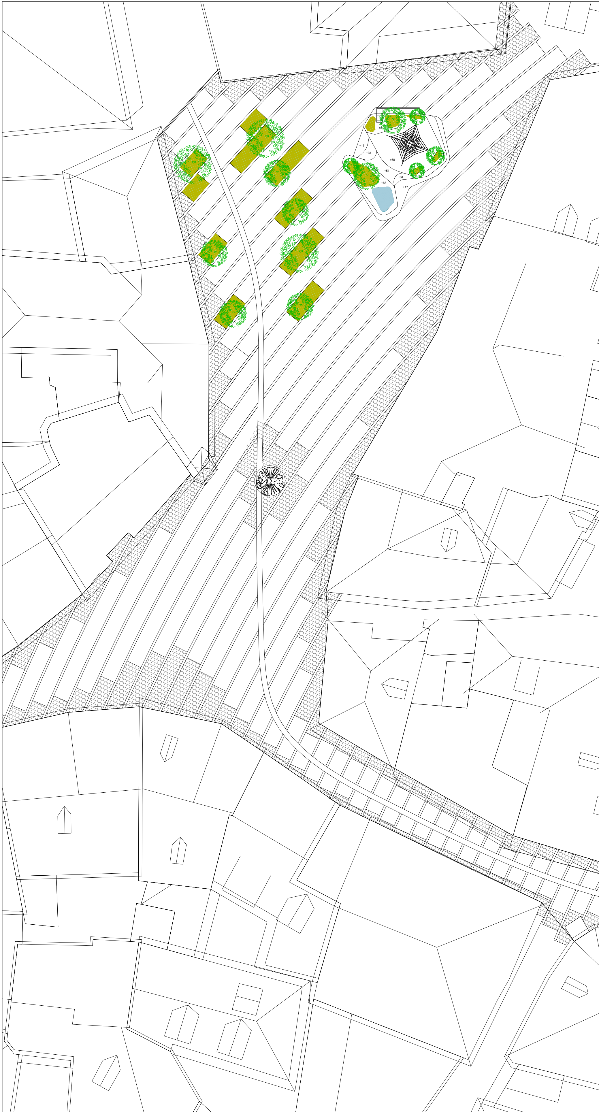
PLANIMETRIA PIAZZA GRANDA